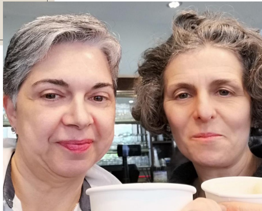
Piccolo aperitivo di benvenuto