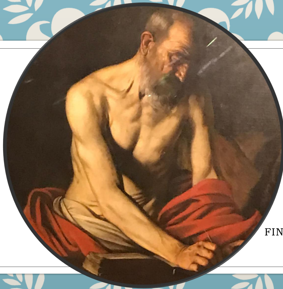
FINALMENTE! CARAVAGGIO «San Girolamo scrivente»