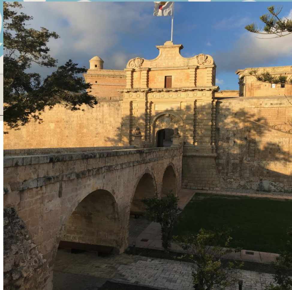
MDINA: la vecchia capitale