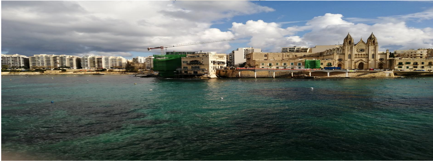
Panoramiche di St. Julians