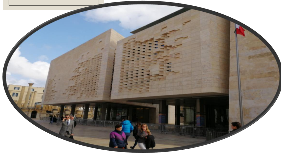
Il Parlamento maltese ( Arch. Renzo Piano)