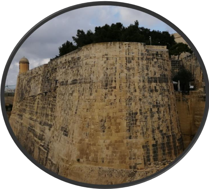
Gli antichi bastioni della capitale