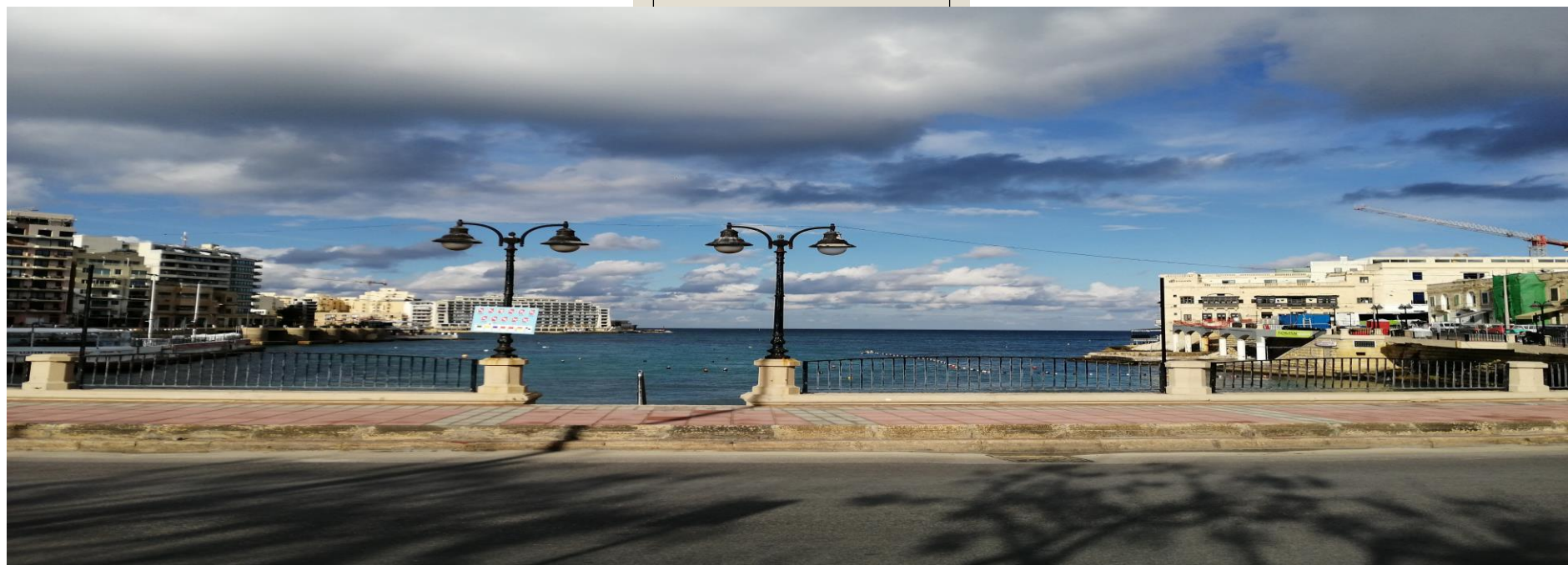
Sempre panoramiche di St. Julians