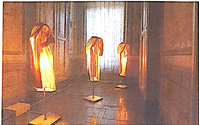
Nell'ex tribunale. Una suggestiva esposizione al Mo.Ca. fiore all'occhiello dell'amministrazione comunale